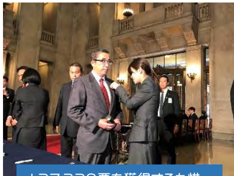
127,329票を獲得するも惜敗。比例復活を果たす。