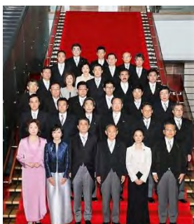
2度目の副大臣 総務副大臣(自治・消防・総務)に就任。地方行政や地方財政などを所管する総務省中枢で活躍。