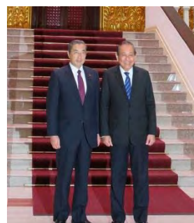
ベトナム訪問。ピン筆頭副大臣と両国の戦略的パートナーシップに基づく多様な協力関係、統計分野における協力について、ハイレベル会談。