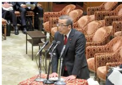
衆議院第1委員会にて担当副大臣として答弁。