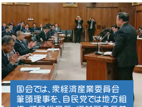
国会では、衆経済産業委員会筆頭理事を、自民党では地方組織・議員総局長、選対副会長兼事務局長を務める。