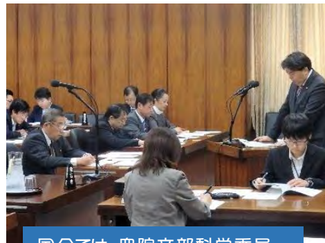
国会では、衆院文部科学委員会筆頭理事を、自民党では副幹事長を務める。