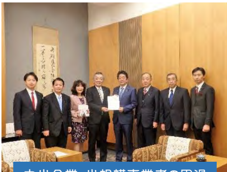
中小企業・小規模事業者の円滑な世代交代を後押しする議員連盟として安倍晋三内閣総理大臣に提言を申入れ。