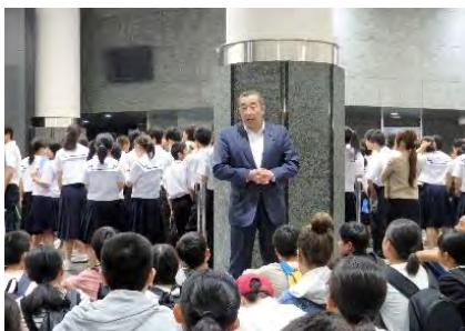
公務の合間に地元中学生の修学旅行(国会見学)であいさつ。